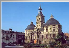
L'échevinage : vestige de l'ancienne abbaye.

La forêt de Raismes-St Amand, vous offre de nombreux itinéraires équestres ainsi que des circuits cyclo-nature et pédestre.